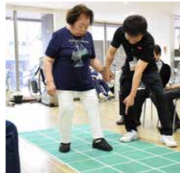
スクエアステップ▶

身体機能のみではなく、スクエアステップ運動の実施など、認知症予防・転倒予防・糖尿病予防という多角的な観点からサービスを提供し、利用者さまをトータルでフォローします。