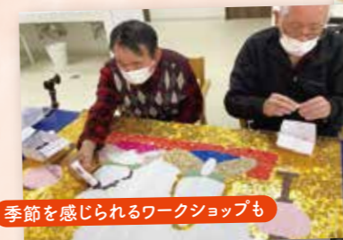
季節を感じられるワークショップも

「外出など、みんなでワイワイにぎやかに過ごしたい」「体力作りだけではなく、趣味を持ちたい」などの利用者さまの声をもとに、様々なクラブ活動や外出を企画していきます。