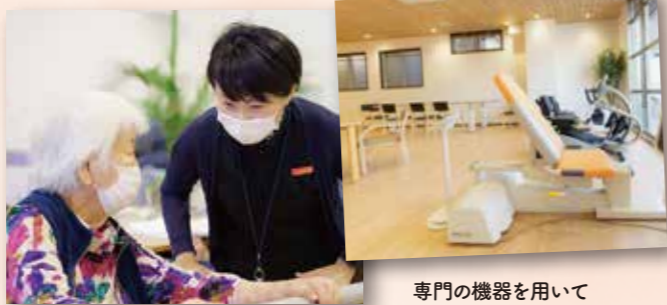
専門の機器を用いてお身体のバランスをチェックします

リハビリの専門家であるセラピストが常駐し、プログラムを管理しているので、楽しい活動の中にも体の機能維持に効果的な要素が盛り込まれたリハビリを行うことができます。また、お一人おひとりの状態に合ったリハビリプログラムの立案も可能です。評価結果をデータ化し、利用者さまはもちろん、ご家族とも情報を共有することが可能です。リハビリの効果を目に見える形で確認していただけます。