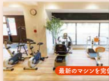
最新のマシンを完備