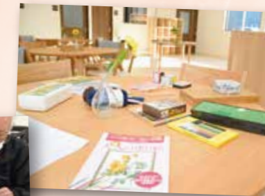
室内で自分のペースでできるレクリエーションも多数開催!