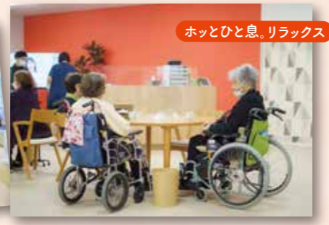
ホッとひと息。リラックス