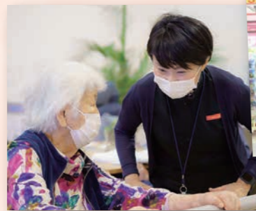
日常生活動作を快適に行えるようお手伝いします