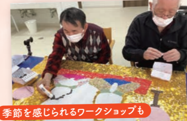
季節を感じられるワークショップも