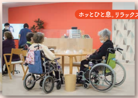
ホッとひと息。リラックス