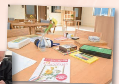
室内で自分のペースでできるレクリエーションも多数開催!