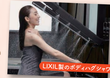
LIXIL製のボディハグシャワー