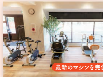
最新のマシンを完備