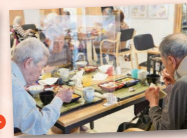
美味しく、栄養管理されたお食事です。みんなで食べると食もすすみます