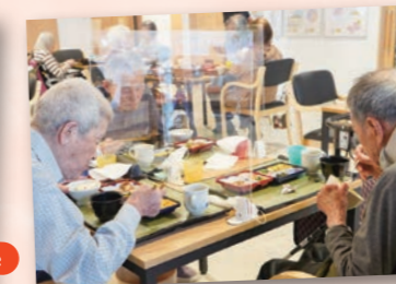
美味しく、栄養管理されたお食事です。みんなで食べると食もすすみます