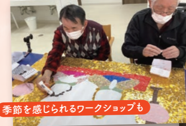
季節を感じられるワークショップも