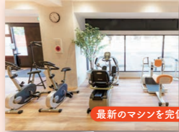
最新のマシンを完備