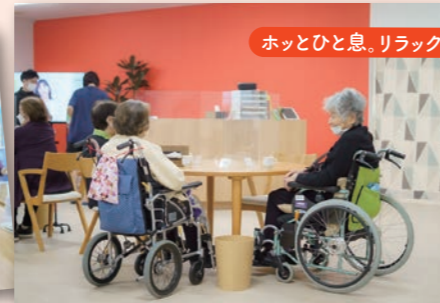
ホッとひと息。リラックス