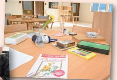
室内で自分のペースでできるレクリエーションも多数開催!