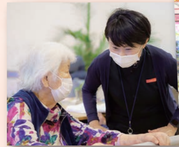
日常生活動作を快適に行えるようお手伝いします